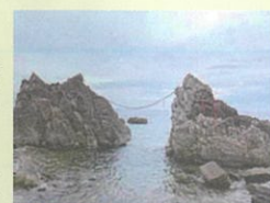
(写真は、③ 雄龍雌龍の岩です)

世界一美しいロケット発射場があることや、サーフィンなどのマリンスポーツが出来ることで有名ですが、実は意外と知られていない場所も沢山あります。