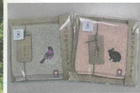
(下) 機内販売ハンカチ

JACでは加盟企業である太平電機株式会社が作成・販売する希少種の刺繍が施されたタオルハンカチを機内販売し、売上の一部を自然保護団体に寄付をしています。