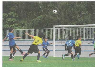
ちびっこサッカー（与論町）

わたしたちは、全国でもただ一つ、5つの島（奄美大島・喜界島・徳之島・沖永良部島・与論島）で一つの青年会議所として、活動しています。奉仕・修練・友情の3つを信条として、ともに向上し、社会に貢献したいと願う20歳～40歳の青年で活動しています。奄美群島の明るい豊かな社会の実現のために、社会課題に取り組んだり、国際青年会議所と連携し、世界各国とつながりながら活動しています。