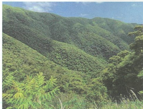
(左) 奄美大島 世界自然遺産登録区域 湯湾岳周辺

JACが加盟する世界自然遺産推進共同体は次世代に「奄美群島の宝」である自然と文化を継承し、環境保全と地域振興の両立をはかるべく民間同士が結束して立ち上げた団体であり現在63の企業・団体が構成されています。また、加盟する各企業・団体がそれぞれの強みを活かし、自然の保全と活用、未来への継承というサイクルを持続していくため、地元の皆さまと一緒に、さまざまな活動を展開しています。