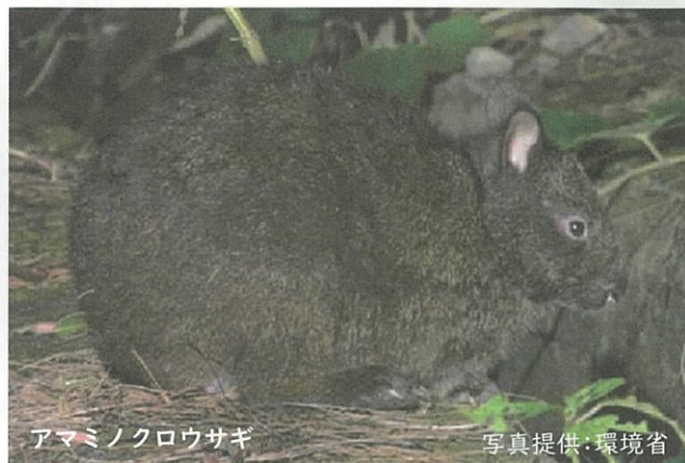
アマミノクロウサギ