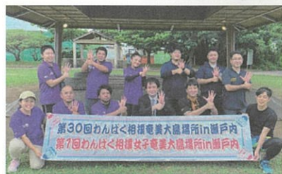
わんぱく相撲（瀬戸内町）

例えば、スポーツを通じて、子どもたちの健全な成長と、地域をつなぐ機会として、与論島では、小学生向けに「ちびっこサッカー」、瀬戸内町では群島内の小学生・未就学児とともに、「わんぱく相撲奄美大島場所」を開催しました。子どもたちの懸命な姿や、礼節を学ぶ姿勢に、主催する私たちも、たくさん学ぶ機会となっています。