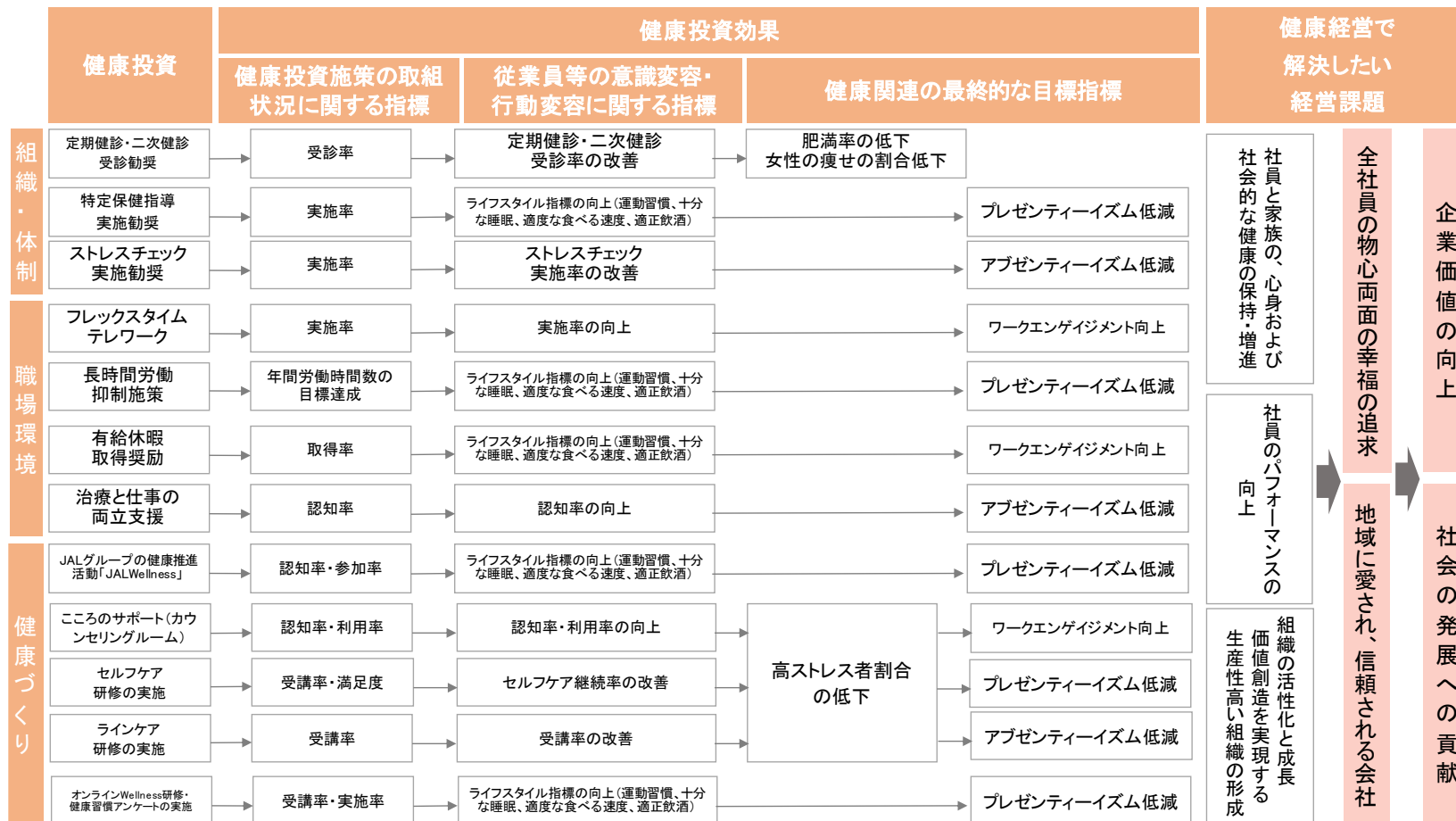
健康経営戦略マップ

*健康経営戦略マップとは、自社の課題と健康経営の取り組みのつながりを整理するためのツールとして経済産業省が企業等における健康経営の取り組みをさらに促進するため策定した「健康投資管理会計ガイドライン（2020年6月公表）」で紹介している