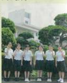
種子島中央高校 情報処理科のみなさん